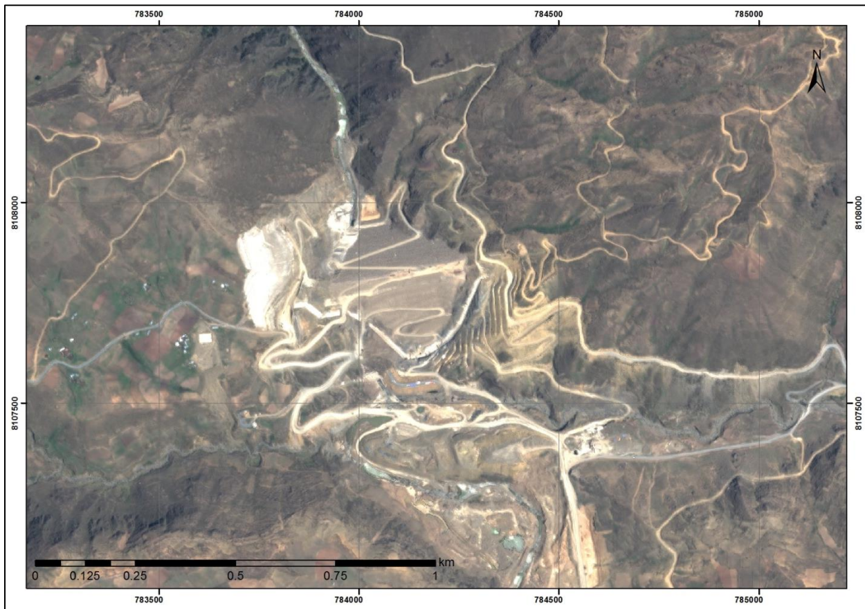
Sistema de Coordenadas WGS84-UTM Zona 19